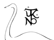
SUOMEN TOLKIEN-SEURA KONTU RY