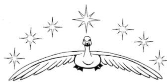
SUOMEN TOLKIEN-SEURA KONTU RY