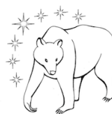
SUOMEN TOLKIEN- SEURA KONTU RY