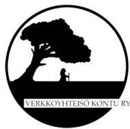
2. UK ry:n vanha tunnus