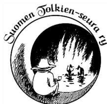
1. STS:n vanha tunnus

Valittiin mikä logo tahansa, niin teksti päivitetään tai lisätään Suomen Tolkien-seura Kontu ry:ksi.